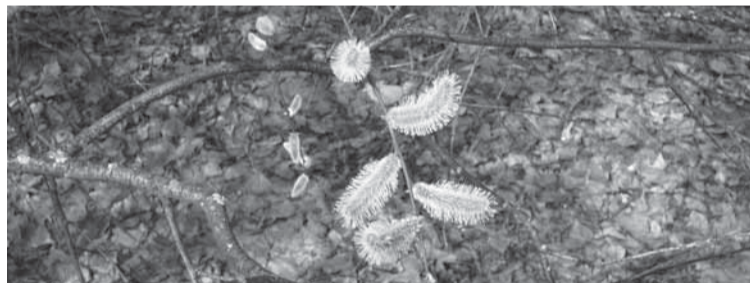
Vår i Pripjat två kilometer från Tjernobyl, april 2010.