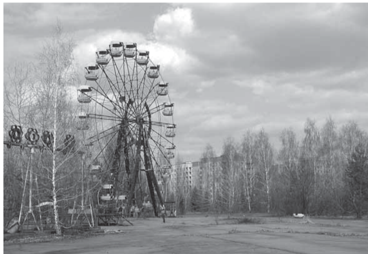
Det fina lyckohjulet hann aldrig invigas i Pripjat.